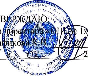
График работы бракеражной комиссии