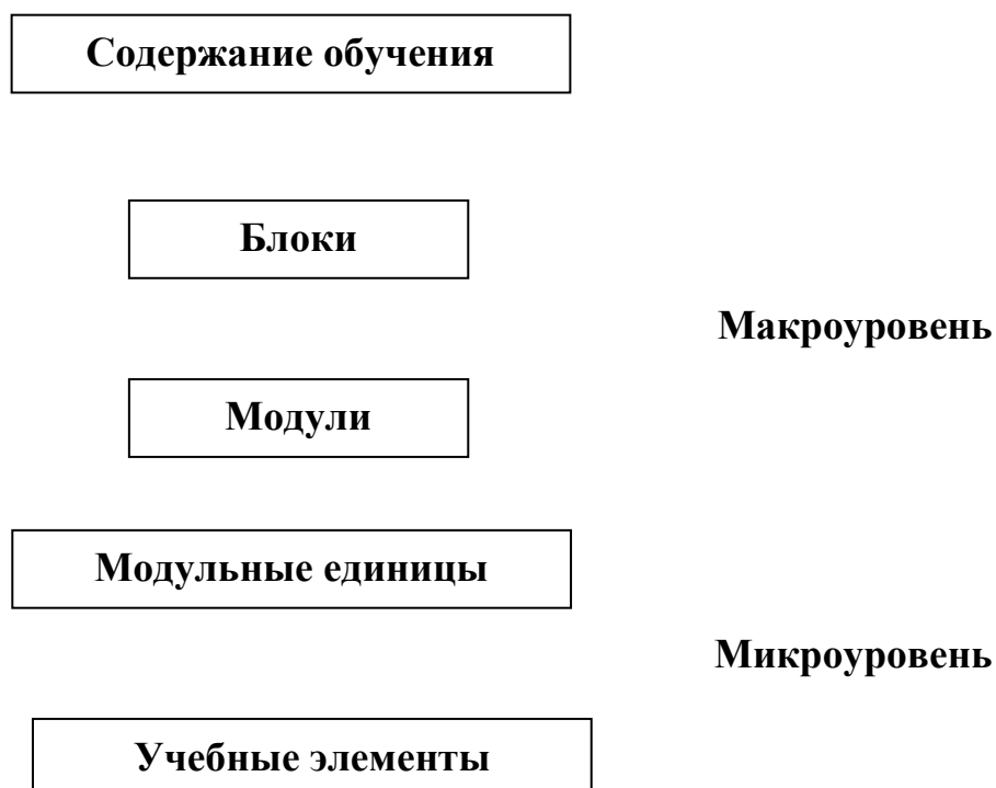
Рисунок 1 – Базовая модель проектирования содержания образования

Образовательная программа школы, призванная решать задачи оптимизации и повышения эффективности учебного процесса, является одним из главных факторов формирования функциональной грамотности, содержание которой строится на основе базовой модели блочно-модульной системы проектирования содержания непрерывного образования, представленной на рис. 1[36].