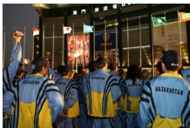
Подъемный вариант (флаг)