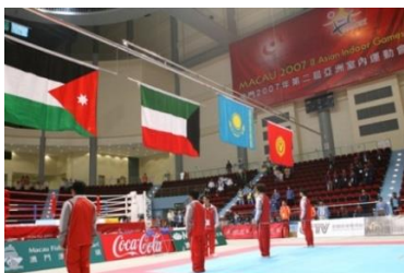
При победе на спортивных соревнованиях спортсмена Республики Казахстан