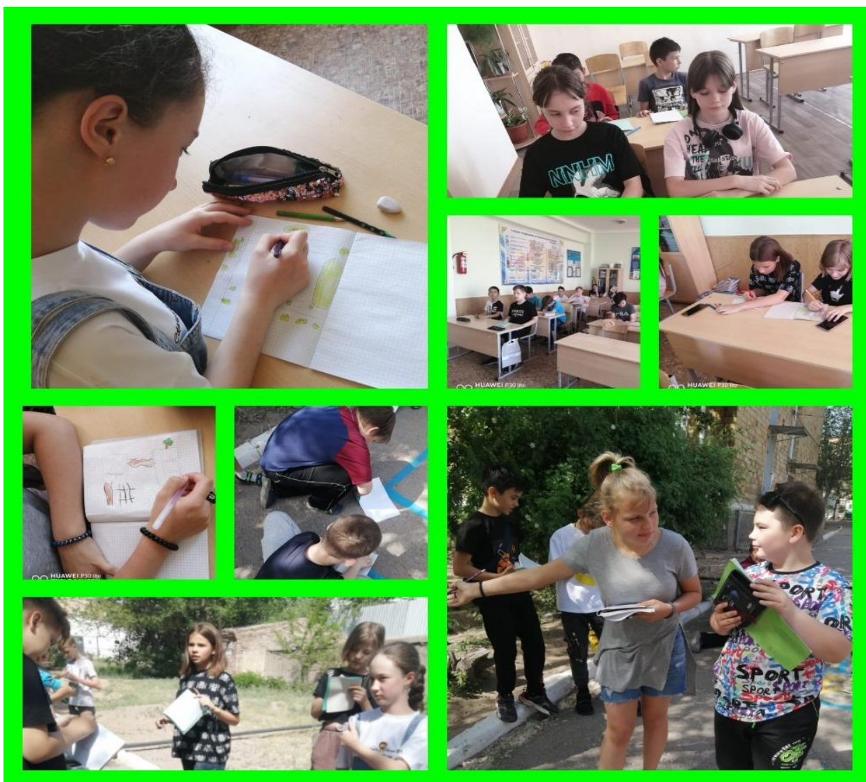
5 е классы. План местности. Условные знаки