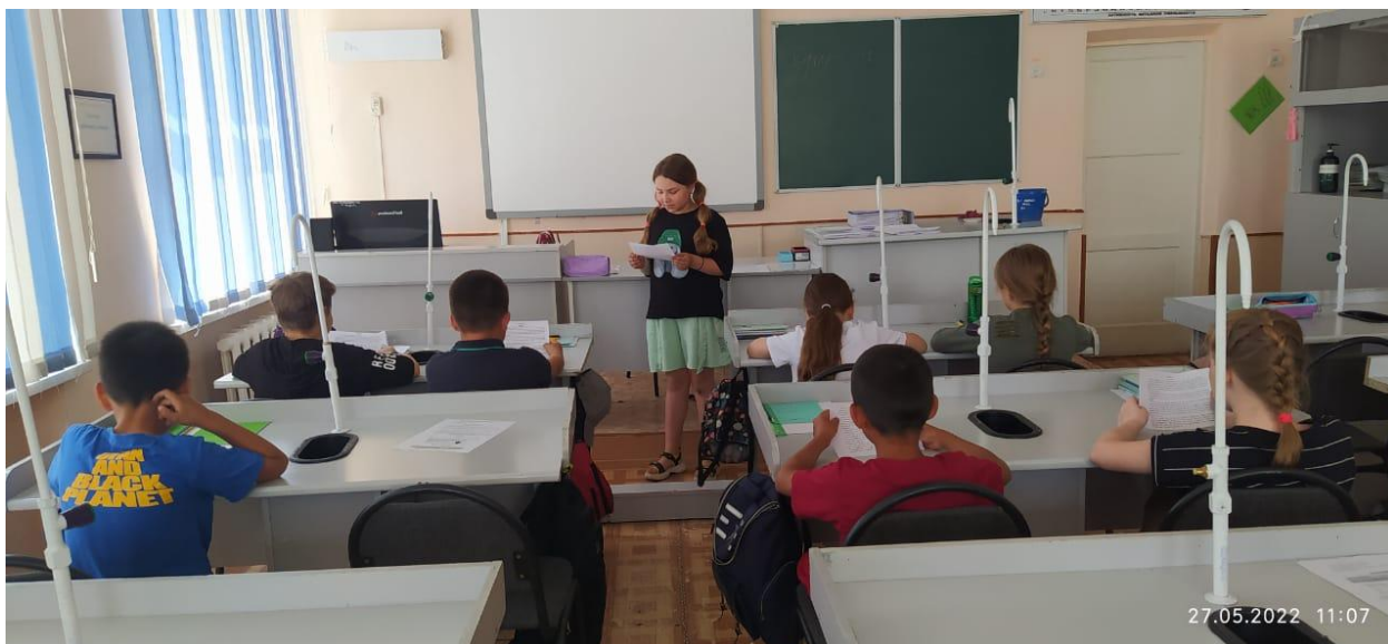
М. Пришвин рассказы о природе. 3 А класс.