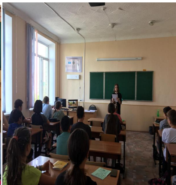
6"Б". Тема: Летопись нашего города. Цель: расширить

Цель: Определять способы применения воздуха в разных сферах жизнедеятельности человека.