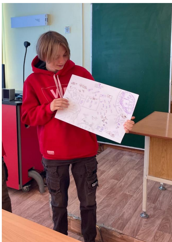
8 А класс Тема: Великая Отечественная война