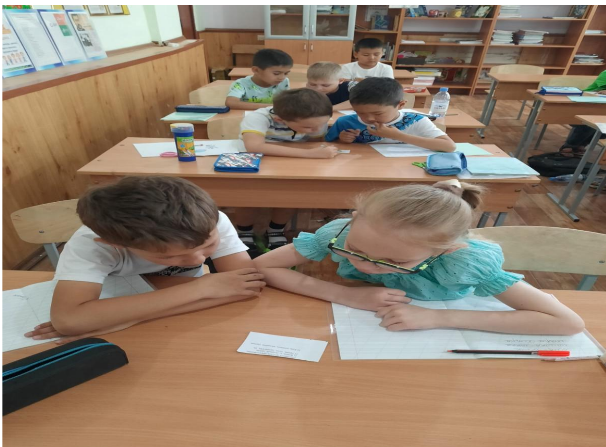
1Б Работа в парах