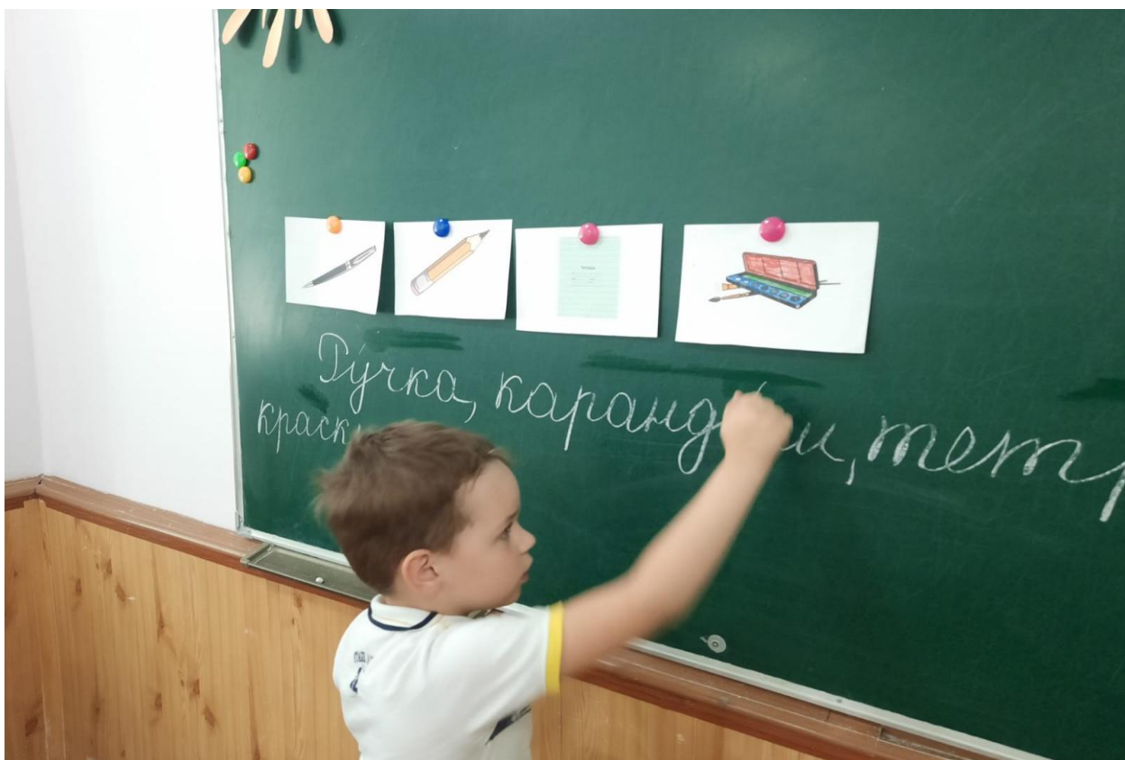
1 Б класс урок Обучения грамоты. Картинный диктант.