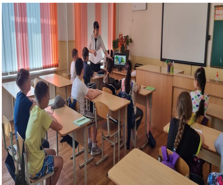
4 Б класс. Тема: Воздух и его свойство. представление о родном городе.

Цель: Определять способы применения воздуха в разных сферах жизнедеятельности человека.