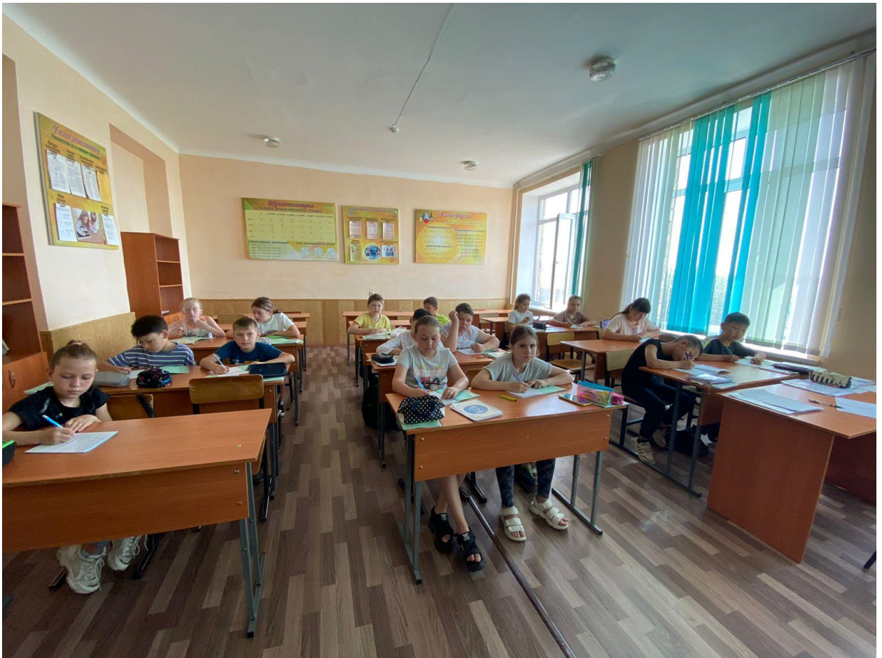
4 «А» класс. Тест на определение уровня английского языка.